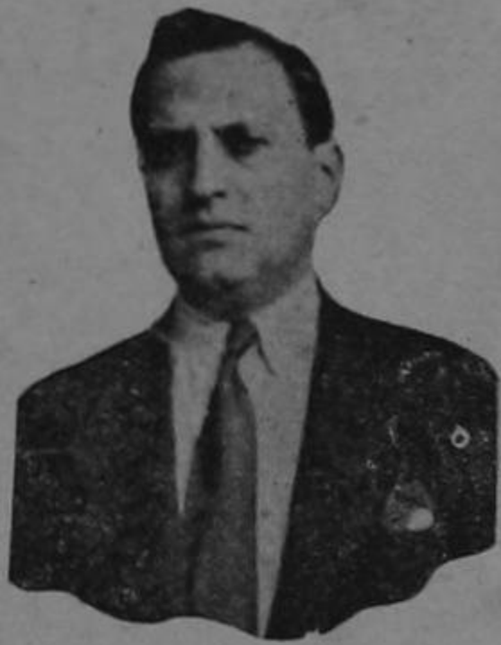
El Doctor Rafael Angel Calderón Guardia

Sin género de duda, el Dr. Calderón Guardia, es uno de los genuinos representantes de la juventud costarricense, que por sus personales cualidades ha logrado conquistar con la simpatía de los diversos sectores políticos, un lugar destacado entre los hombres con que cuenta el porvenir de la república.